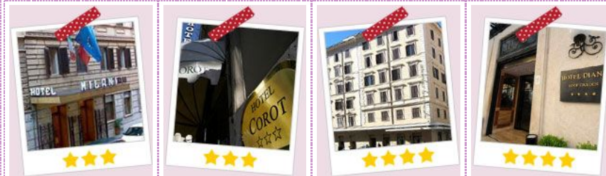
ミラニ(ローマ) コロット(ローマ) ジェノバ(ローマ) ティアナ(ローマ)