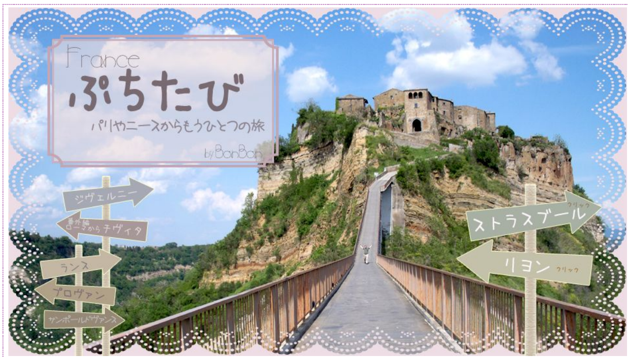
ローマからぷち (Petite da Roma)