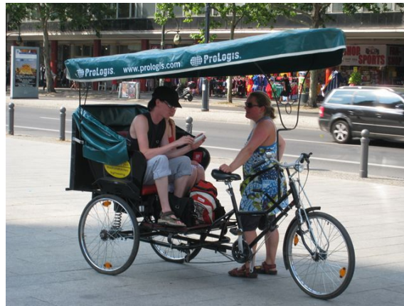
これはタクシー型の自転車。色んな形があります。

一日10ユーロ位でレンタルできます。ただし、ドイツには基本「ママチャリ」タイプの自転車はない（もしくはすごく少ない）ので、スポーツタイプの自転車になります。そんなこんなで街のなかでは自転車をとってもよく見かけます。中には見たことないような面白い自転車も！