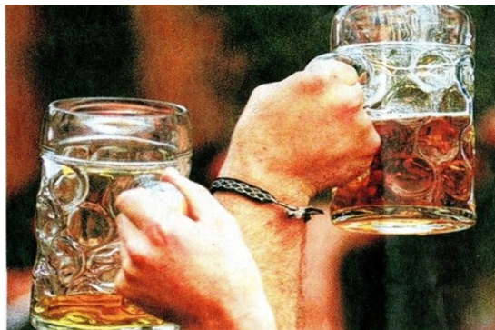
Prost! So schmeckt's am besten: eine kühle Maß im Biergarten - wenn da nur der steigende Preis nicht wäre...

これは 2005 年から今年の 1 リットルのビールの価格の推移。毎年値上がりしているんですね。まあ、こんな数値を出すところがドイツらしいです。ちなみに、ジョッキは必ず片手で持つべし。なんだそうですよ。(すごく重いので、私は 500ml でも難しいのに…。筋トレあるのみ?)